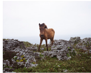
▲ Charlotte Dumas, Aan de kust, Yonaguni , 2015. COLLECTIE ANDRIESSE EYCK GALERIE